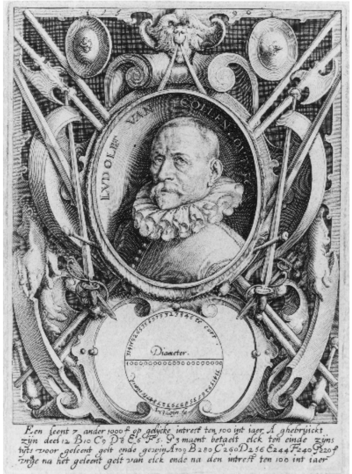
Figuur 4. Titelpagina van Van den circkel (1596)

Het woord ‘Hiere’ komt in het Nederlands niet voor, en zal daarom waarschijnlijk een verschrijving door de Engelsman Skippon of van de drukker zijn (vergelijk het Engelse ‘Here’). Er zal ‘Hier’ gestaan hebben. Evenzo is ‘liet’ beslist onjuist; opnieuw een verschrijving die zich laat verklaren door een vergelijking met het Engels. Op grafstenen uit dezelfde tijd komt zowel ‘leit’ als ‘leyt’ voor. We hebben gekozen voor het